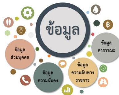
ภาพที่ 3 หมวดหมู่ของข้อมูล

1) ข้อมูลสาธารณะ คือ ข้อมูลที่สามารถเปิดเผยได้สามารถนำไปใช้ได้อย่างอิสระ ไม่ว่าจะเป็นข้อมูลข่าวสารข้อมูลส่วนบุคคลข้อมูลอิเล็กทรอนิกส์ เป็นต้น