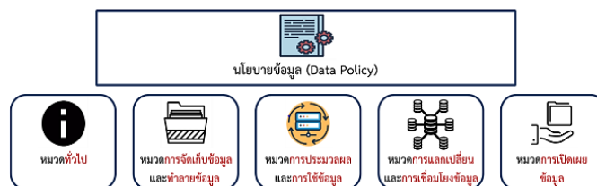
ภาพที่ 1 นโยบายข้อมูล

ดังนั้น เพื่อให้ภารกิจสำคัญในการกำหนดวิธีการบริหารจัดการธรรมาภิบาลข้อมูลให้สอดคล้องกับพระราชบัญญัติการบริหารงานและการให้บริการภาครัฐผ่านระบบดิจิทัล พ.ศ. 2562 ซึ่งข้อมูลที่อยู่ในระบบสารสนเทศของ สปอ. เป็นพื้นฐานสำคัญในการพัฒนาระบบดิจิทัลที่จะสามารถบูรณาการข้อมูล และการทำงานทั้งด้านการบริหารภายใน และการอำนวยความสะดวกให้กับประชาชนได้อย่างมีประสิทธิภาพ ศูนย์เทคโนโลยีสารสนเทศและการสื่อสาร สำนักงานปลัดกระทรวงอุตสาหกรรม (ศทส.สปอ.) มีภารกิจในการดูแล ควบคุมข้อมูลดังกล่าว จึงได้กำหนดนโยบายข้อมูลของ สปอ. ที่จัดเป็นส่วนหนึ่งในพื้นฐานของธรรมาภิบาลข้อมูลภาครัฐขึ้น เพื่อให้สอดคล้องกับพระราชบัญญัติดังกล่าว และตามกรอบการกำกับดูแลข้อมูล (Data Governance Framework) ของสำนักงานพัฒนารัฐบาลดิจิทัล (องค์กรมหาชน) (สพร.) โดยนโยบายข้อมูลของ สปอ. ครอบคลุมระบบบริหารและกระบวนการจัดการข้อมูลหรือวงจรชีวิตข้อมูล ทั้งนี้ ให้มีการเผยแพร่ประชาสัมพันธ์นโยบายข้อมูลให้แก่บุคคลหรือหน่วยงานที่เกี่ยวข้อง เพื่อให้มีความรู้ความเข้าใจต่อการปฏิบัติตามนโยบายข้อมูลภายใต้กรอบนโยบายข้อมูล