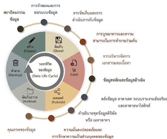
ภาพที่ 2 ระบบบริหารและกระบวนการจัดการข้อมูล หรือวงจรชีวิตของข้อมูล และองค์ประกอบในการบริหารจัดการข้อมูล

วงจรชีวิตของข้อมูล หรือระบบบริหารและกระบวนการจัดการข้อมูล คือ ลำดับขั้นตอนของข้อมูล ตั้งแต่เริ่มสร้างข้อมูลไปจนถึงการทำลายข้อมูล ประกอบด้วย 6 ขั้นตอน ดังนี้